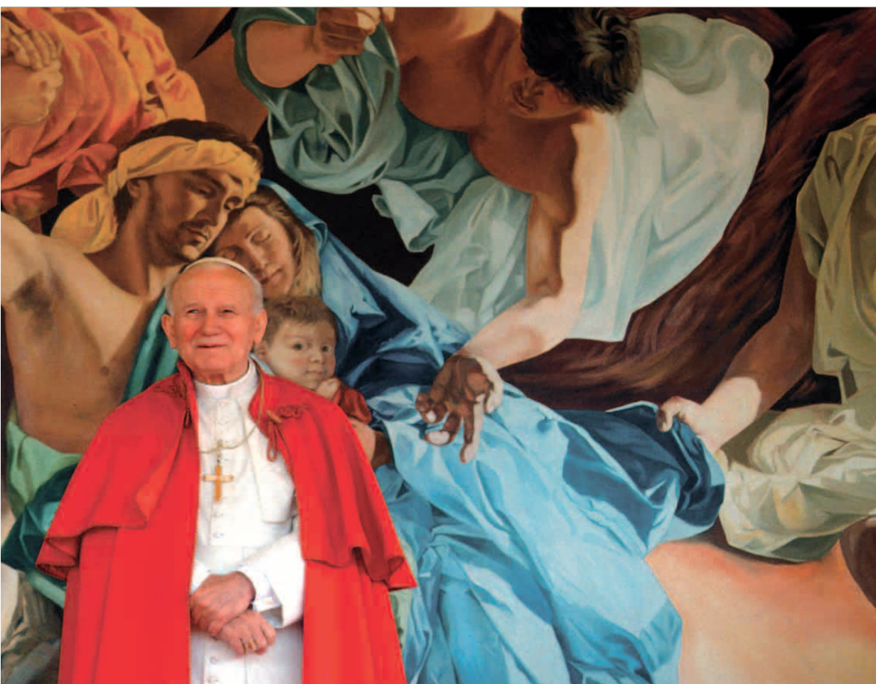
Juan Pablo II en 1993.

Si ya no hay nada por lo que valga la pena morir, entonces también la vida resulta vacía. Sólo si existe el bien absoluto, por el que vale la pena morir, y el mal eterno que nunca se transforma en bien, el hombre es confirmado en su dignidad y nosotros nos vemos protegidos de la dictadura de las ideologías.