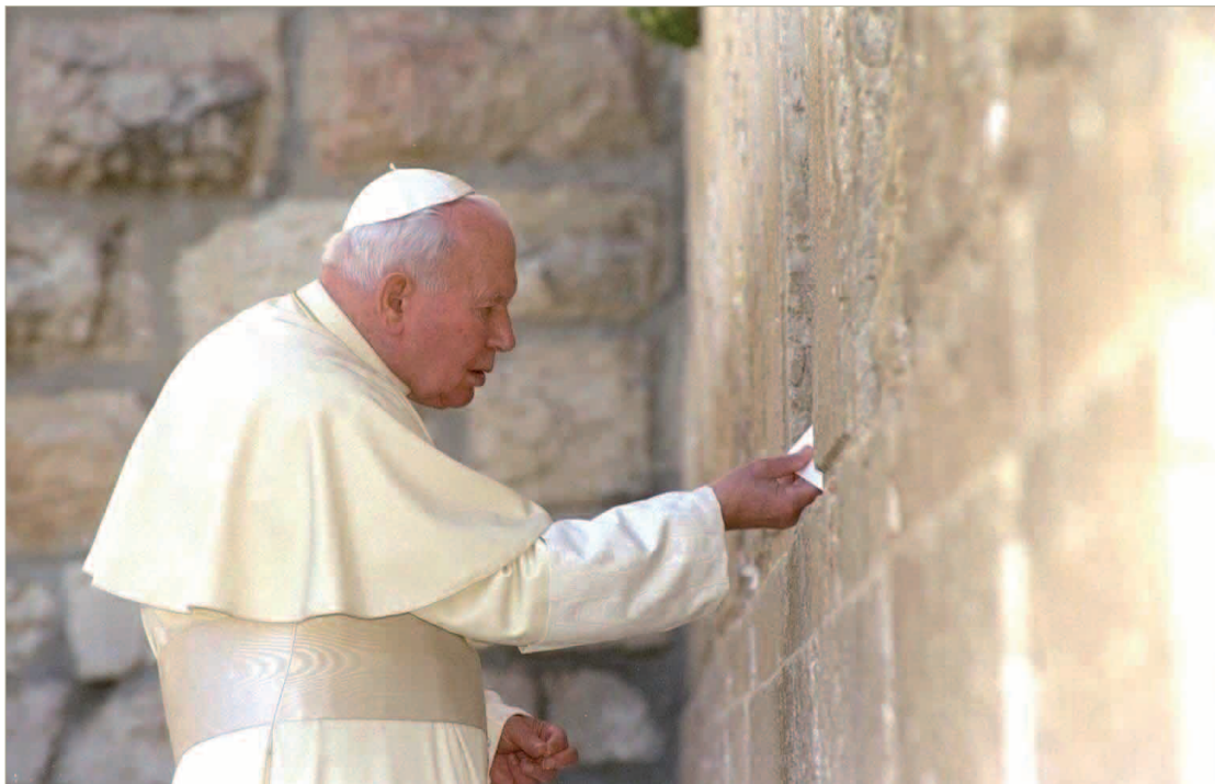
Juan Pablo II en el Muro de las Lamentaciones, Jerusalén, 26 de marzo de 2000

» ANTROPOLOGÍA Y CRISTOLOGÍA. Para el Papa, antropología y cristología son inseparables. Precisamente Cristo nos ha revelado qué es el hombre y a dónde debe ir para encontrar la vida. Este Cristo no es sólo un modelo de existencia humana, un ejemplo de cómo se debe vivir, sino que «está unido, en cierto modo, a todo hombre» ( ib. ). Cristo nos toca en nuestro interior, en la raíz de nuestra existencia, transformándose así, desde el interior, en el camino para el hombre. Rompe el aislamiento del yo; es garantía de la dignidad indestructible de cada persona y, al mismo tiempo, es quien supera el individualismo en una comunicación a la que aspira toda la naturaleza del hombre.